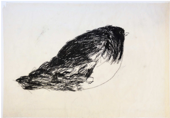
Omar Moussa: ohne Titel, 2012, Kohle-Ölkreide auf Vorsatzpapier, 91x64