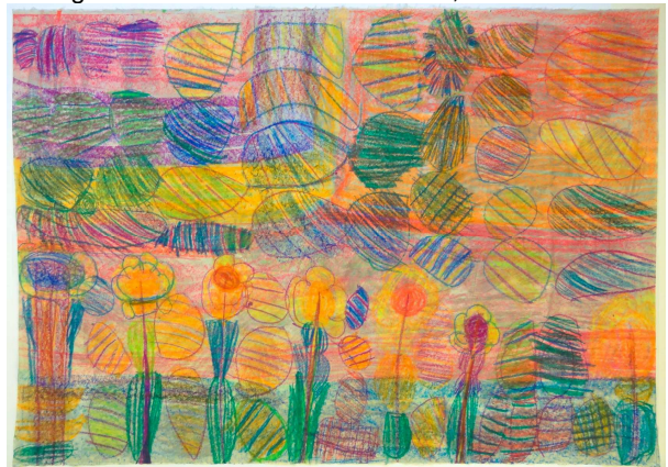
Alexandra Rothausen: ohne Titel, 2012, Kohle-Ölkreide auf Vorsatzpapier 93x64