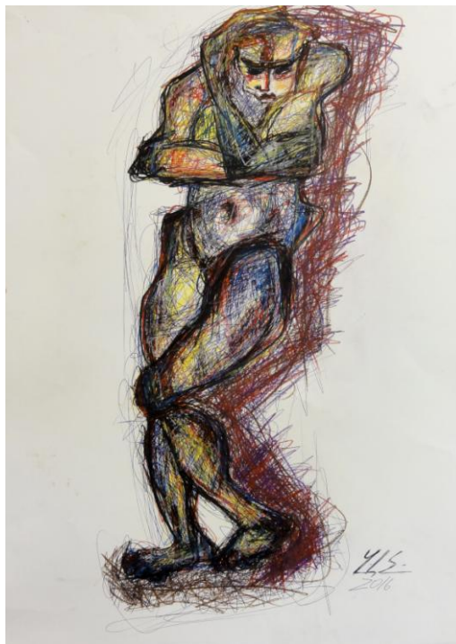
Linda Soravia, Nudo 13, 2016, Buntstift Kugelschreiber, Papier, 70x50