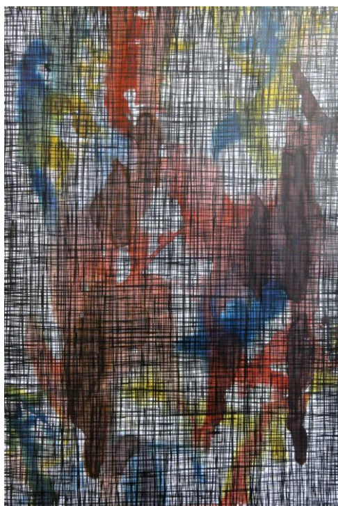
Elke Lachert, Gitterwerk 2, 2016 Tusche, Papier, 58x40

Trägerverein: PS-Art e.V. Berlin Oranienburger Straße 27 10117 Berlin-Mitte